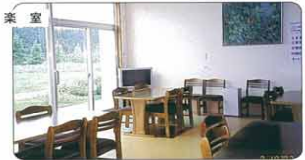
お買い物送迎・レクリエーションの援助をいたします