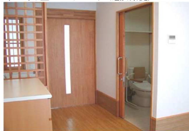
(ユニット型ショートステイの施設環境)